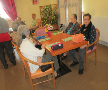
Maintien en forme